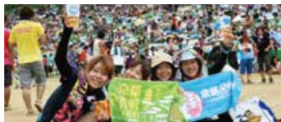
音楽イベントでリユース！