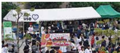
学園祭でリユース！