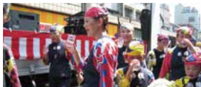
地域のお祭りでリユース！