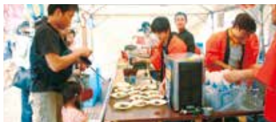
祇園祭でリユース！