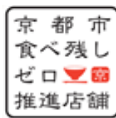
飲食店・宿泊施設版