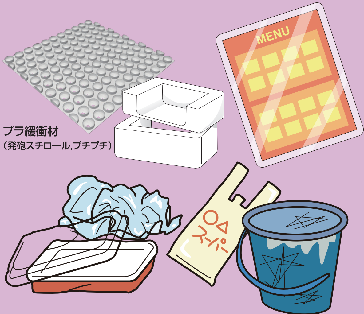
プラ緩衝材 (発砲スチロール, プチプチ)