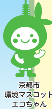
京都市 環境マスコット エコちゃん