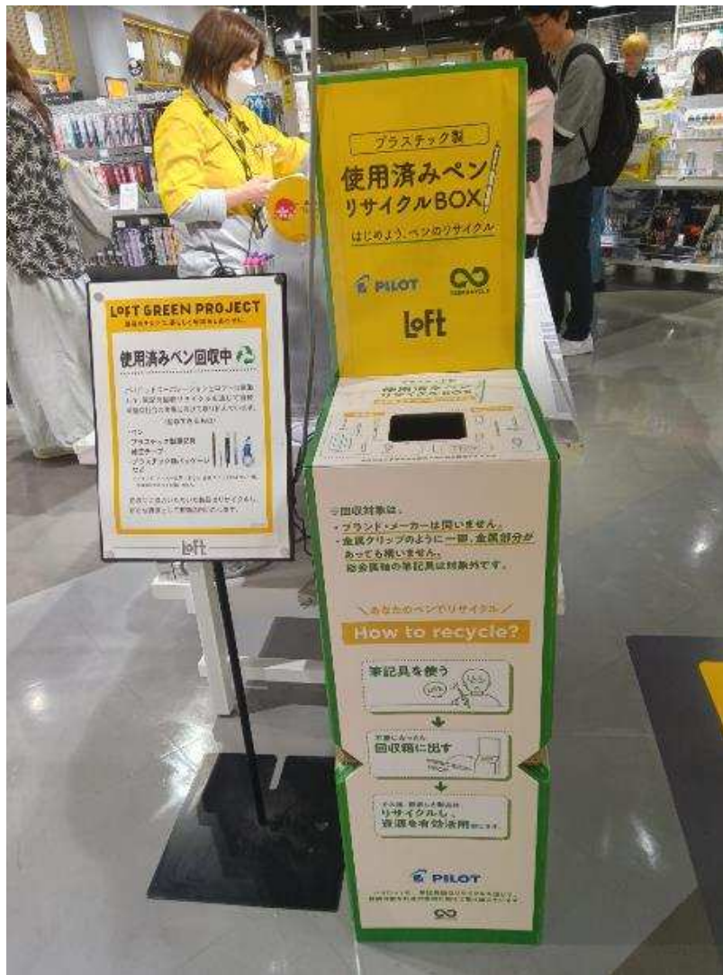
使用済みペン回収